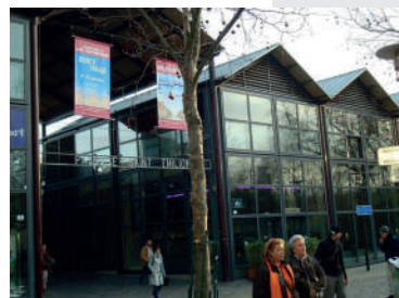
Centro comercial e antigos galpões de vinícola.