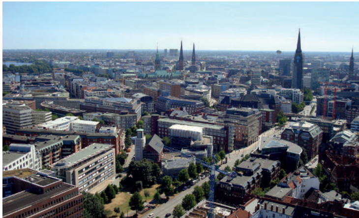
Vista de HafenCity. Destaque para a Sala de concertos – Herzog & de Meuron. / Vista panorâmica de Hamburgo a partir da torre da Catedral de St. Mary. Fotografias: Denise Antonucci, julho, 2013.