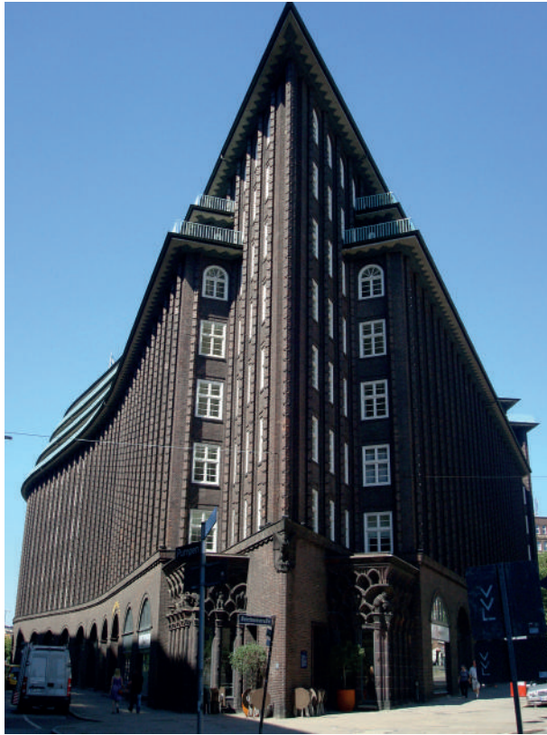
Conjunto gótico-expressionista Chilehaus – Arquiteto Fritz Schumaker / Museu Marítimo. Fotografias: Denise Antonucci, julho, 2013.