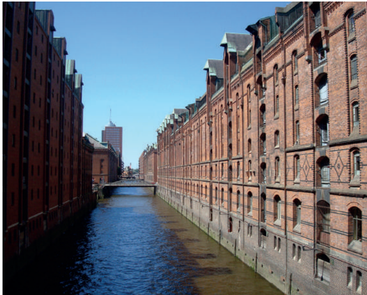
Novos edifícios e espaços públicos. / Paredes recuperadas do cais. Fotografias: Denise Antonucci, julho, 2013.