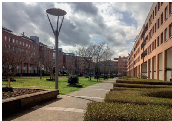
Áreas internas das quadras na cidade antiga e em Céramique.