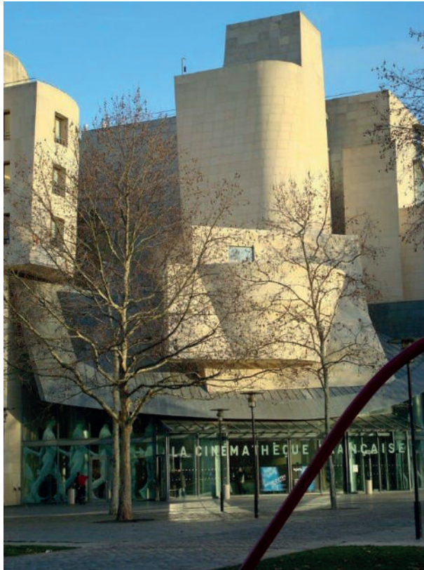
Desenvolvimento habitacional – Cinemateca Francesa – Escola ambiental em edifício preservado inserida no parque.