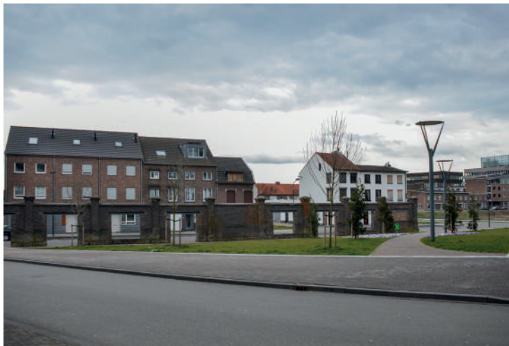
Vista do Parque Charles Eyk, com conjunto residencial, e Museu Bonnefanten de Aldo Rossi ao fundo. / Vista do antigo muro da fábrica, mostrando as antigas casas do entorno e o jardim triangular criado por elas e os novos edifícios. Fotografia: Lorreine Cláudio, 2013.