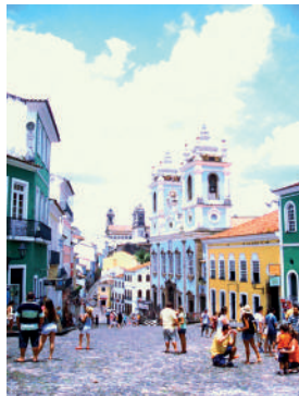
Pelourinho – Salvador. Fotografia: Denise Antonuccio, dezembro, 2013.