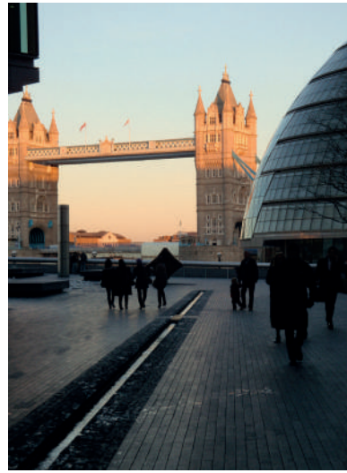
Skyline com a inserção do edifício de 30St. Mary Axe – Foster + Partners. Fotografia: Denise Antonucci / London Bridge e o edifício do City Hall – Foster + Partners. Fotografia: Nadia Somekh

zação da paisagem urbana. O principal deles é o gerenciamento de vistas através de cones visuais: pode ser estabelecido em relação a edifícios e monumentos específicos e em relação a vistas panorâmicas. Esses instrumentos são previstos no plano diretor de Londres (Great London Plan, policy 7.12) e são monitorados pelo prefeito por uma política específica, a LVMF (London View Management Framework).