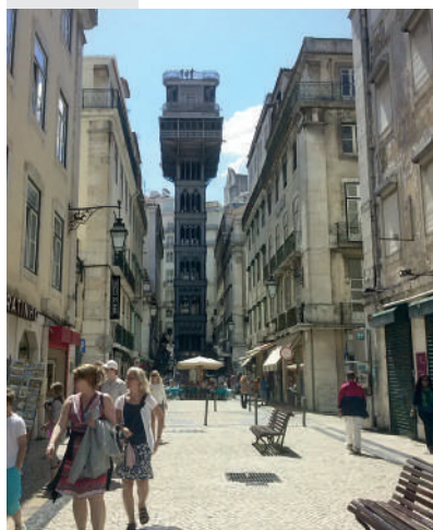
Representação de reabilitação do espaço público em Lisboa.

A reabilitação do espaço público tem um importante papel nos projetos.